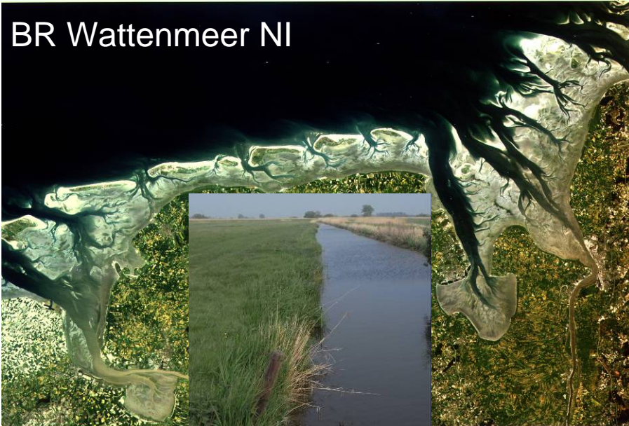
BR Wattenmeer NI